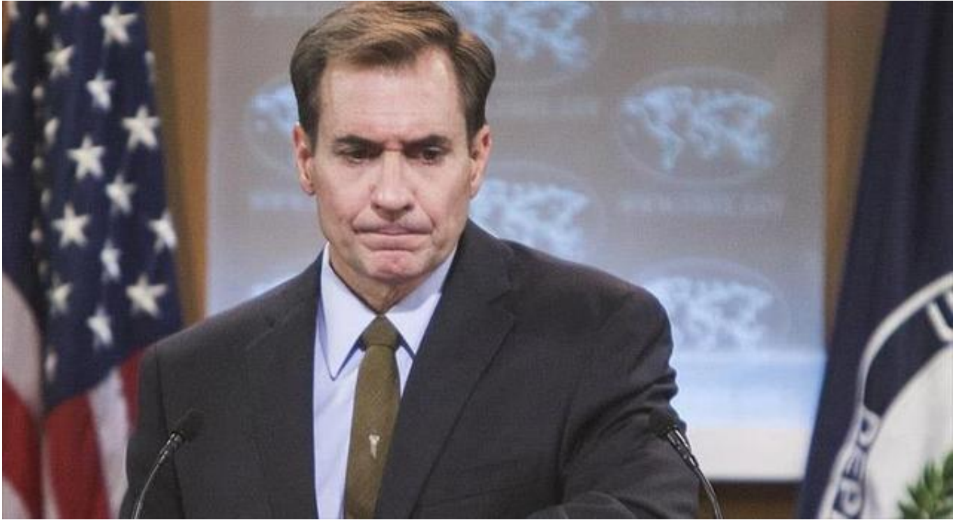
叙利亚11月时势，黄色为土耳其权力，绿色为叙阻挡派

美国国务院此前还表现，并不晓得“伊斯兰国”武装分子能否从摩苏尔抵达了巴尔米拉，但不清除这种能够。