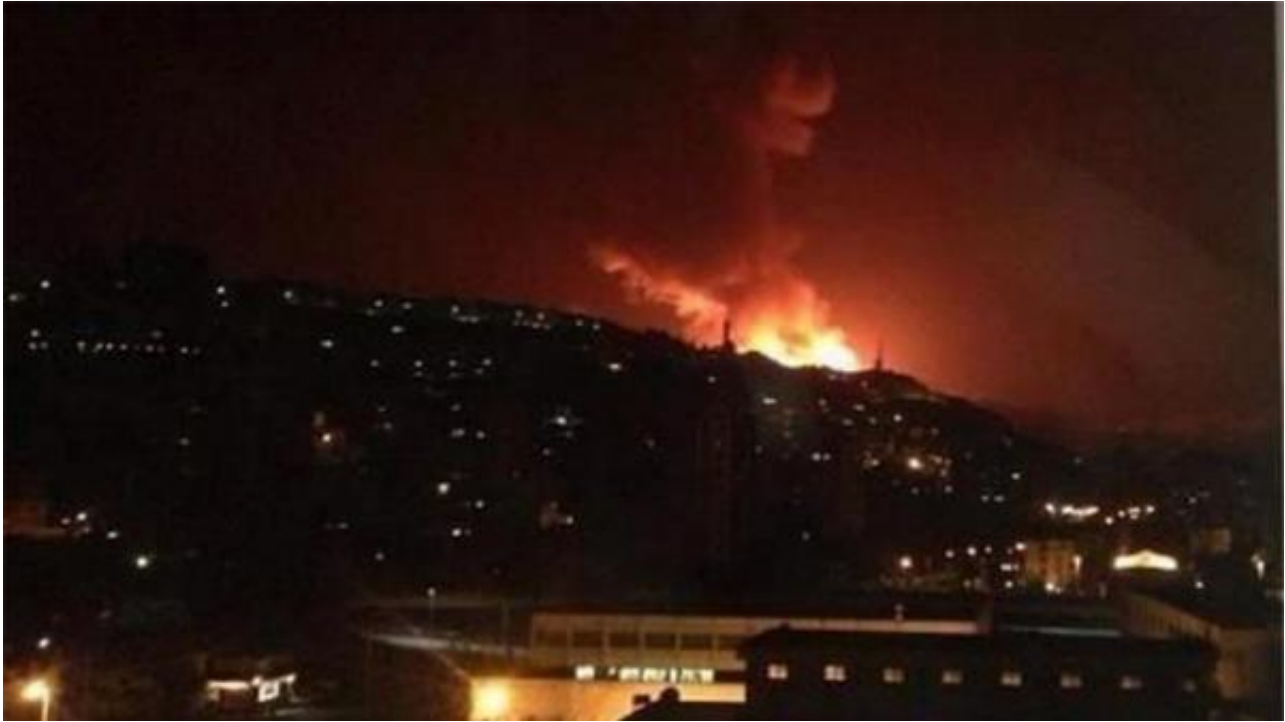
巴尔米拉正在鏖战

俄罗斯国际文传电讯社征引俄罗斯在叙利亚协调中央新闻报道，“伊斯兰国”从拉卡和代尔祖尔派出了少量武装职员，凌驾4000人口在巴尔米拉重新集结后再次提倡防御，和叙利亚政府军交火。